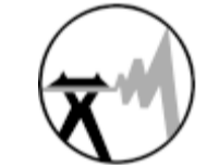
وزارت نیرو شرکت برق منطقه ای غرب