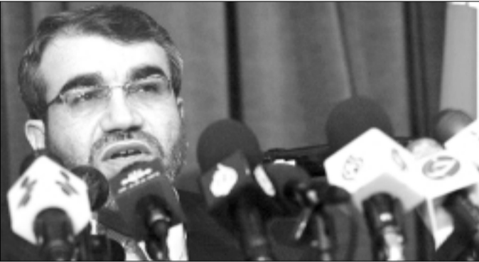
عباسعلی کدخدایی، سخنگوی

شورای نگهبان دیروز با تشریح عملکرد یک شورا، گفت : تمام نظام‌های سیاسی نهاد نظارتی مانند شورای نگهبان دارند. به گزارش ایرنا، کدخدایی در سخنانی تصریح کرد: شورای نگهبان بعنوان نهادهی که ضرورت آن در تمام نظام‌های سیاسی دنیا به اثبات رسیده است و تمام نظام‌های سیاسی به نوعی از وجود یک نهاد نظارتی مانند شورای نگهبان بهره مند هستند، در جمهوری اسلامی ایران پس از تصویب قانون اساسی، کار خود را آغاز کرد.