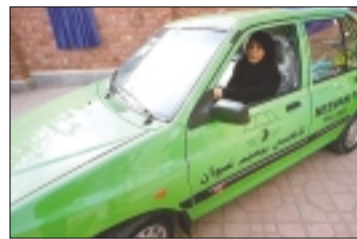
ورود ۲ هزار دستگاه تاکسی ویژه بانوان تا پایان سال