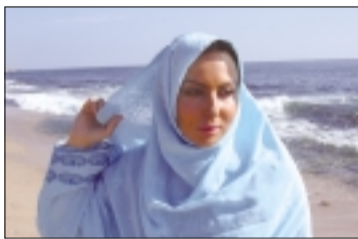
سینما را ترجیح می دهیم