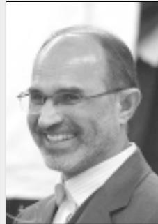
غلامحسین نودری گفت: درآمدهای نفتی در ۱۱ ماه امسال به ۵۵ میلیارد دلار رسیده و پیش بینی شده است، این رقم تا پایان امسال به حدود ۶۳ میلیارد دلار برسد. به

گزارش شانا، وزیر نفت در حاشیه نشست هیات دولت در باره بورس نفت نیز اظهار داشت: بورس کالای نفت در روز یکشنبه ۲۸ بهمن ماه امسال با حضور وزیر اقتصادی و دارایی افتتاح خواهد شد و مبنای بود. نودری درباره بودجه واردات بنزین و منبع تامین آن نیز گفت: مصرف بنزین هم اکنون روند طبیعی خود را دارد و امسال نیز همانند سال های گذشته، برای واردات بنزین از منابع داخلی استفاده شد. وی با بیان این که مصرف نفت گاز به دلیل اختصاص آن به نیروگاه ها در سال جاری افزایش داشته است، در باره توسعه گازرسانی گفت: تنظیم افزایش میزان گازرسانی