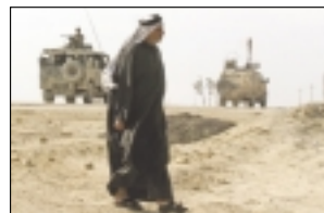
صورت حساب جنگ عراق برای کشورهای عربی صفحه ۷