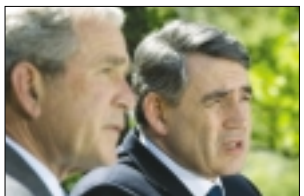
براون: تحریم ها علیه ایران را در چند هفته آینده تشدید می کنیم صفحه آخر