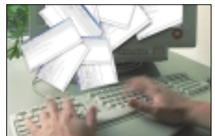
هرزنامه ۳۰ ساله شد