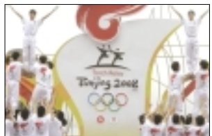
آینده چین در گرو سیاسی ترین المپیک تاریخ