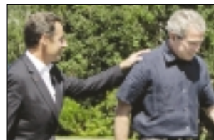
تغییر در سیاست خارجی فرانسه