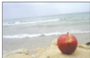
خلیج فارس همان دریای پارس داریوش است