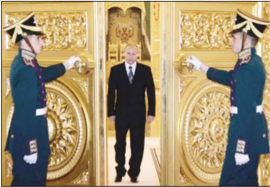
پوتین امروز با کرملین خداحافظی می کند

کلیه معاون وزیر بازرگانی از سیستم بانکی: