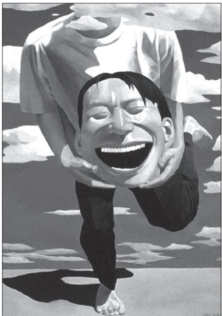
آثاری از یو پوینو، نقاش چینی

هنر مدرن چین تحت تأثیر جنبش نوین فرهنگی این سرزمین شکل گرفته است