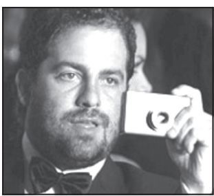
جنگ» را در برنامه شغلی اش دارد.

سرویس سینمایی: برت راتنر، کارگردان فیلم «ساعت شلوغی» که پیش از این قرار بود بر مبنای مجموعه بازی های ویدئویی به نام «قهرمان گیتار» فیلم بسازد، از این پروژه فیلمسازی کنار رفت. این کارگردان درباره این موضوع می گوید من به ساخت فیلمی بر مبنای بازی «قهرمان گیتار» علاقه دارم، اما با توجه به اینکه این بازی اکنون نظارات طرفدارانش را برآورده می کند، عوامل سازنده فیلم آن اعلام کرده اند که دلیلی برای ساخت فیلمی درباره این بازی ویدئویی وجود ندارد. شایان ذکر است که راتنر ساخت چهارمین قسمت فیلم «پلیس بولنی هیلز» و فیلمی با اقتباس از یک بازی ویدئویی به نام «اله