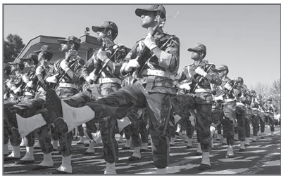
سربازان هشتم که دادن این تسهیلات به سربازان نیازمند کمک دولت و مجلس است.

مدیرکل مشمولان ستادکل نیروهای مسلح گفت: تکلیف طرح کاهش مدت زمان سربازی تا مهر ماه مشخص خواهد شد. به گزارش ایسنا، کمالی در حاشیه مراسم افتتاحیه نمایشگاه سازمان نظام وظیفه عمومی ناجا در جمع خبرنگاران گفت: این طرح در صورت اجرایی شدن، به نسبت مساوی در تمام مناطق عادی، عملیاتی و محروم تا آذر ماه امسال اجرایی خواهد شد. وی درباره طرح بومی سازی سربازی نیز اظهار کرد: این طرح به عنوان یکی از اهداف نظام وظیفه عمومی دنبال نمی شود، بلکه سازمان به دنبال این موضوع است که جوانان با دریافت آموزش در مواقع