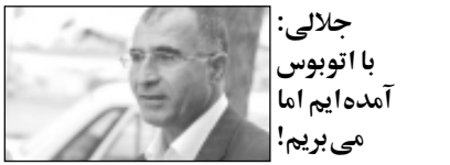
جالالی: با آفتابپور آمده ایم اما می‌بریم!