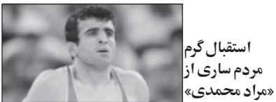
استقبال گرم مردم ساری از «مراد محمدی»

مراد محمدی، قهرمان سوم و دارنده مدال برنز المپیک ۲۰۰۸ پکن در میان استقبال گرم همشهریان‌ش وارد ساری شد. محمدی یکی از ۲ مدال آور کاروان ورزش ایران در المپیک پکن عصر روز دوشنبه وارد ساری شد و مورد استقبال گرم همشهریان خود و همچنین مسئولین قرار گرفت. دارنده مدال برنز وزن ۶۰ کیلوگرم المپیک در این مراسم گفت: کسب مدال المپیک یکی از رویاهای من بود و سالها برای این لحظه تلاش کردم. تنها مدال آور کشتی در المپیک افزود: ۱۷ سال برای این لحظه زحمت کشیدم، خوشحالم که دست خالی برگشتم و شرمه مردم مردم شد.