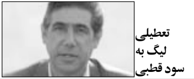
تعطیلی لیگ به سود قطعی