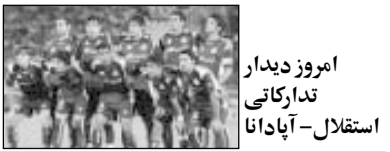
امروز دیدار تدارکاتی استقلال– آپادانا