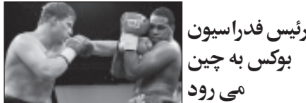
رئیس فدراسیون بوکس به چین می رود

نگاهی به نتایج هفته یازدهم لیگ برتر بسکتبال