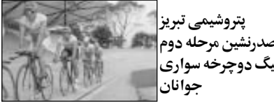
پتروشیمی تبریز صدرنشین مرحله دوم لیگ دوچرخه سواری جوانان

دومین مرحله لیگ دوچرخه سواری جوانان در رشته پیست با صدرنشینی پتروشیمی تبریز به پایان رسید. این مرحله از رقابتها با حضور ۱۲ تیم به مدت ۲ روز در پیست مجموعه ورزشی آزادی انجام شد که تیم پتروشیمی تبریز با ۱۸۹۸ امتیاز درصدر قرار گرفت. تیم ترفایک تهران با ۴۱۸۰ امتیاز در جای دوم قرار گرفت و شهرداری مهریز یزد با ۱۴۶۵ امتیاز مکان سوم را به خود اختصاص داد. گفتنی است در رده‌بندی مجموع ۲ مرحله نیز تیم پتروشیمی تبریز با ۲۲۱۵ امتیاز درصدر قرار داد. تیم ترفایک تهران با ۲۱۰۷ امتیاز در جای دوم است.